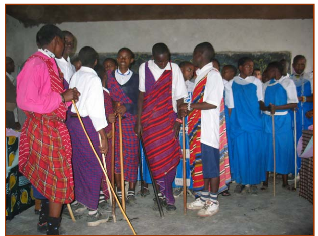
Jeunes Massaï lors de la cérémonie d'adieu

En août, les participants rentraient en Suisse pour reprendre leurs occupations. Je suis resté trois mois supplémentaires à Arusha pour superviser la fin des travaux et visiter de nouvelles écoles primaires de la région pour d'éventuels futurs projets humanitaires.